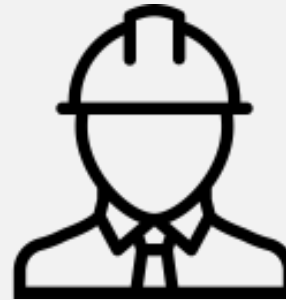
Montage vor Ort